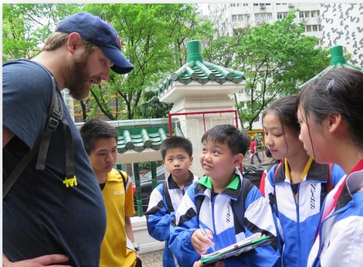
中一學生參與「遊走中上環」活動，走進社區學習

除課堂學習外，「學校起動」計劃亦為孩子帶來了走出課室的機會。在計劃下，初中學生得以參與「遊走中上環」的活動，走出社區，踏足陌生的港島，了解香港的發展。到了他們中四之時，夏至之際，更能參與「職場體驗計劃」，穿起帥氣的西服，踏入中一時遊走過的會德豐地產有限公司及其他大型企業，成為集團的員工，與公司成員結成師友，在計劃完結後持續交流學習。不論是到太平洋會聚餐，還是一起參與義工服務，都讓學生走出社區，擴闊視野，讓生活成為學習本身。到了每年新春，我們又會在荷里活廣場聚首，參與「趁墟做老闆」活動。在「學校起動」計劃的悉心安排下，學生可以在這個活動中實踐課堂所學的理论，一步一步地設計、推廣、銷售商品，當中的熱情與魄力，實在令人動容。除此之外，在「學校起動」計劃的支援下，我校每年得以安排「傑出學生境外學習團」，讓學生不單能走出社區，更可以走遍世界，學習不同地方的文化，充實自我。