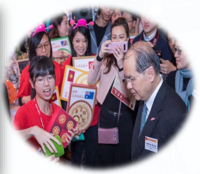
「趁墟做老闆」為師生提供寶貴的營商經驗，學生全面參與營商匯報、策劃及銷售，使其學習經歷更豐盛