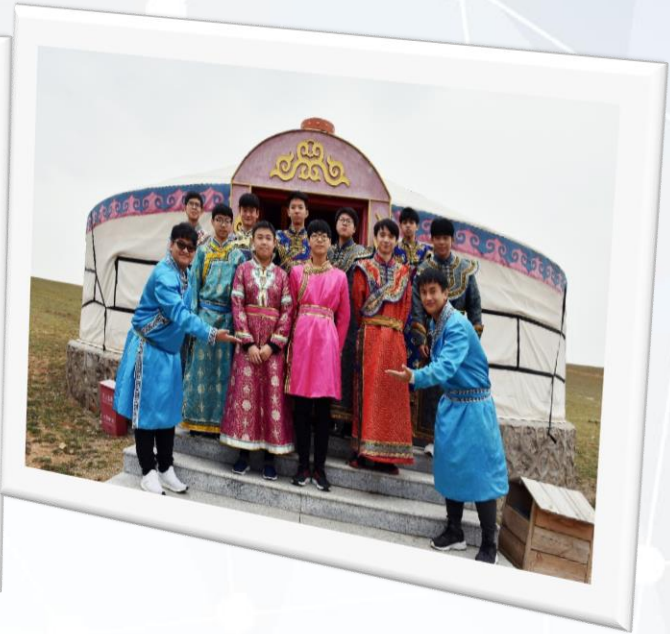
「傑出學生境外學習團」讓師生得以體驗「讀萬卷書不如行萬里路」