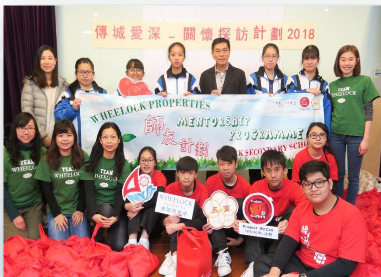
在師友計劃下，會德豐地產的義工團隊成為學生的生命導師，陪伴學生成長