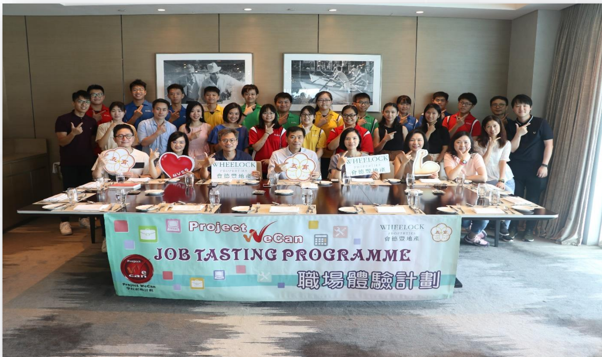
「職場體驗計劃」讓學生體驗各行業，從中學習待人接物的技巧及處事的態度