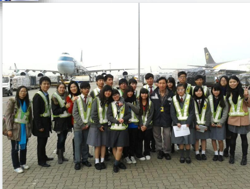
「學校起動」計劃每年均安排企業參觀予 我校師生，讓學生得以擴闊視野