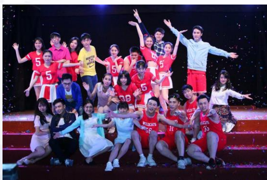
歌舞劇訓練及表演

2017年是本校40周年校慶的盛事，校慶主題活動分別是歌舞劇表演及製作校史牆，這都是「學校起動」計劃支持下得到空前成功。校慶主題活動之一是大型學生歌舞劇表演活動，學生需接受為期一年的訓練，並由專業老師指導下，以英語表演歌舞劇。校慶表演時學生表現投入，獲來賓予以正面的評價。校慶主題活動之二是本校製作一幅極具意義的校史牆，該牆記載著本校建校歷史、先賢們及學生輝煌的印記，藉以提升學生對校園的認同和歸屬感。