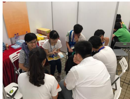
「職」出前路，我做得得到！「學校起動」計劃生涯規劃日