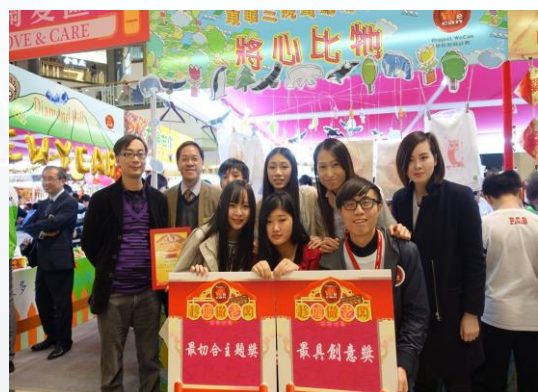
「趁墟做老闆」展銷會