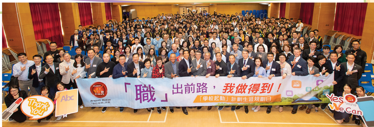
過往實體舉行的「『職』出前路，我做到！」生涯規劃日，學生及嘉賓聚首一堂

為協助同學在未來升學或就業前做好準備，「學校起動」計劃於2015/16年首度推出聯校活動「『職』出前路，我做到！」生涯規劃日，為近25,000名同學提供全方位、一條龍的職業導向活動，啟發他們及早計劃未來。